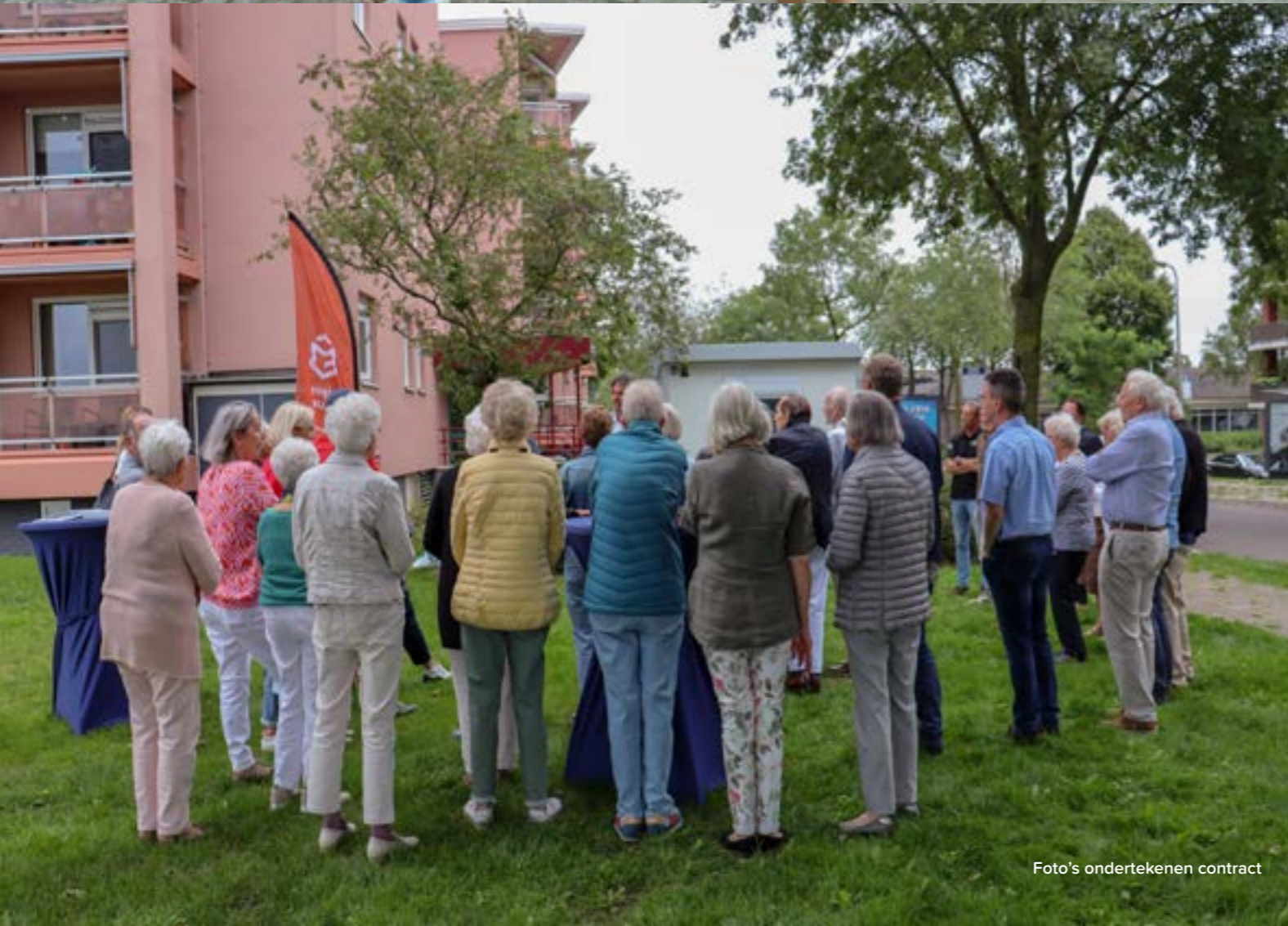
Foto's ondertekenen contract